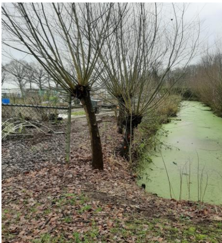
Nu al mooi.....

De volgende foto's brengen de oever van begin tot einde in beeld en tonen het