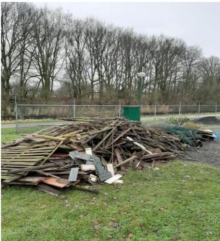
Spreekt voor zich.....

Als bijlage is de procedure “bestellingen zaden” nogmaals toegevoegd.