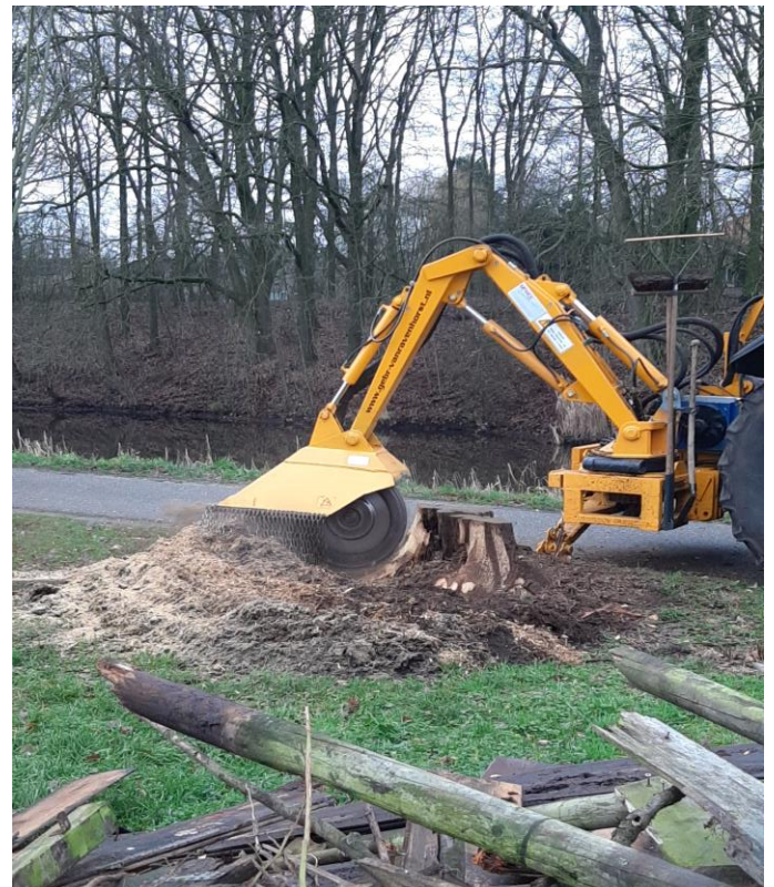
Freesen van de acacia stronk bij de ingang Groen Depot, 6 januari.